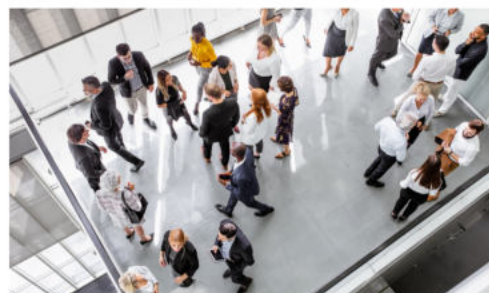
Autist:innen selbst entscheiden lassen, ob und unter welchen Bedingungen sie am Event teilnehmen können.