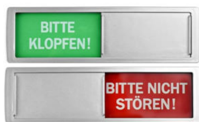
"Bitte klopfen/Bitte nicht stören"- Schild für die Bürotüre

Helfen Sie dabei, Kolleg:innen über Autismus aufzuklären, und wenden Sie sich an Stellen wie die "Einheitlichen Ansprechstellen für Arbeitgebende (EAA)", die Integrationsfachdienste (IFD) oder Autismus-Zentren, die Sie gerne unterstützen.