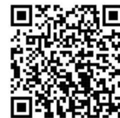
Hier kommen Sie zu unserem Erklärvideo: "Nicht aufzufallen kostet viel Kraft"